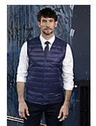
NEOBLU ARTHUR MEN 03172