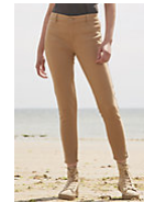
SOL'S JULES WOMEN 01425