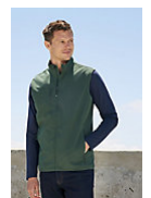
SOL'S FALCON BW MEN 03825