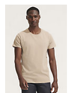
SOL'S CRUSADER MEN 03582