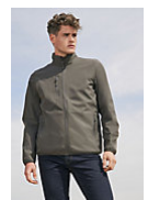
SOL'S FALCON MEN 03827