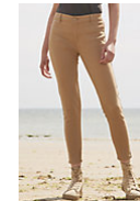
SOL'S JULES WOMEN 01425