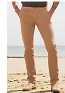
SOL'S JULES MEN - LENGTH 35 02120